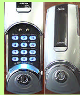
◆最新デジタルロック (オートロック機能付き)