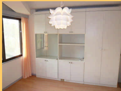
◆たっぷり 収納 スペース