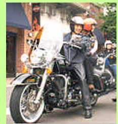
◆全室対応駐輪場 &バイク駐輪OK!