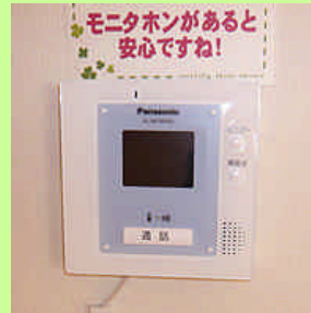
モニタホンがあると 安心ですね!