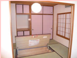
◆お部屋各所に収納スペース