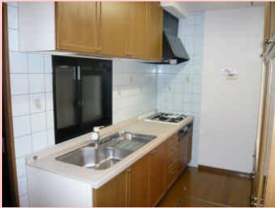
◆大型システム キッチン