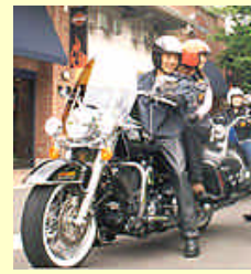
◆専用駐輪場 & バイク駐輪OK!