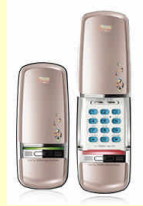
◆最新デジタルロック (オートロック機能付き)