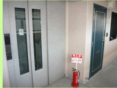
◆窓付防犯 エレベーター