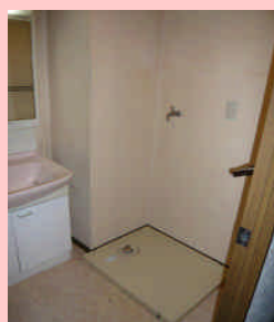
◆快適バスルーム (浴室乾燥・追い焚き機能) & 洗面・洗濯機置場