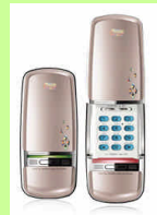
◆最新デジタルロック (オートロック機能付き)