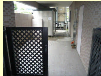
◆ドア付玄関ポーチ & 大型物置