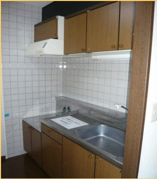
◆ガスレンジ対応 大型キッチン