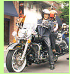
◆全室対応駐輪場 &バイク駐輪OK!