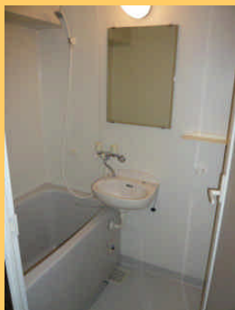
◆快適バスルーム (追い焚き機能)